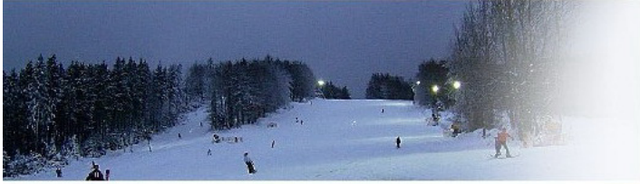
Stand: 27.01.2013