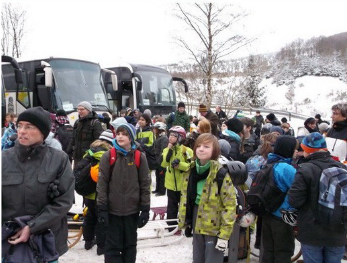
Ankunft an der Ski-/Rodelanlage Bödefeld

Alle 5. Klassen des Landfermann-Gymnasiums brachen am Donnerstag, den 24. Januar 2013 zu einer großen Rodelfahrt nach Bödefeld-Schmallenberg ins Sauerland auf. Die hervorragende Schneesituation wurde genutzt, um dort unterhaltsamen Wintersport zu treiben. Und so sausten die Mädchen und Jungen auf ihren Schlitten immer wieder mit Begeisterung die Pisten hinab. Schließlich kehrte man nachmittags müde, aber glücklich nach Duisburg zurück. Begleitet wurden die Kinder von einem Team aus Sportlehrern, Klassenlehrern, älteren Schülern als Sporthelfer bzw. Schulsanitäter sowie von engagierten Eltern.