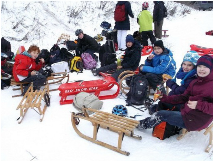
Wer viel rodeln, braucht auch eine Brotzeit.