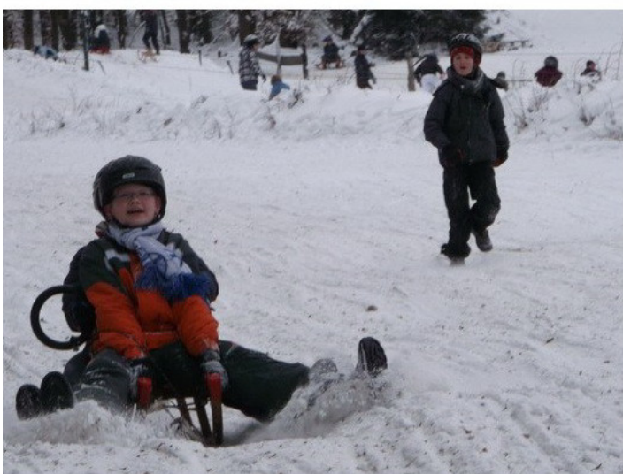
Hier gestaltet sich das Bremsverhalten sehr umsichtig und vorbildlich.