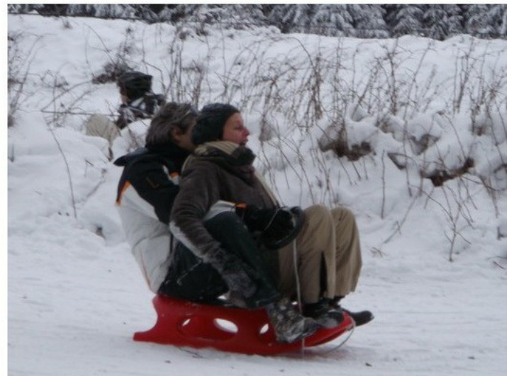
Klagen über zu kleine Leihschlitten wurden von unseren professionellen Pädagogen-Rodlern klar widerlegt.