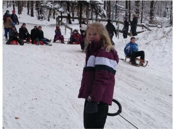
Und weiter geht's ...