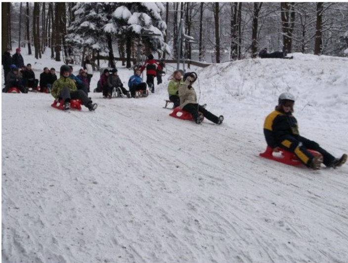
Ein geordnet-disziplinierter Start stellte sich mit zunehmender Rodelerfahrung ein.