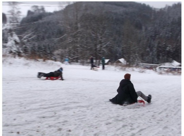
Fuß voraus oder Bauchlage – voller Schneegenuss garantiert.