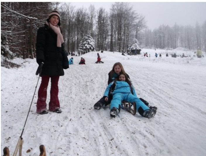
Schule - mal ganz anders!