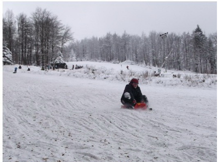
Erste Abfahrten wurden noch zaghaft unternommen.