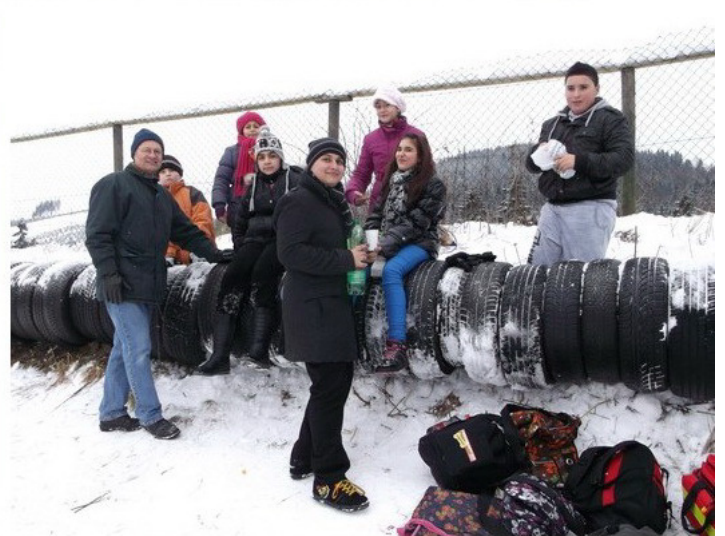
Lehrer und Schüler hatten einen fröhlichen, anstrengenden und ereignisreichen Tag mit viel Rodelspaß.