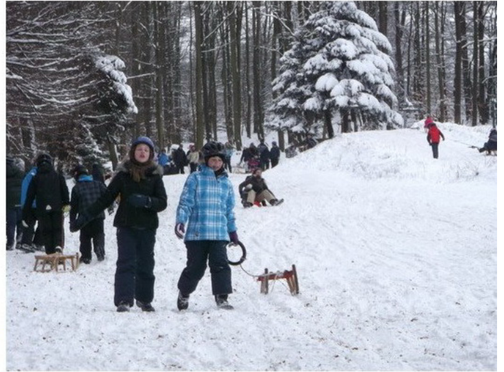
Rodeln im Sauerland: "Das ist richtig toll!"